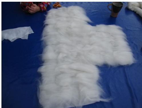
Ull lagt på silke