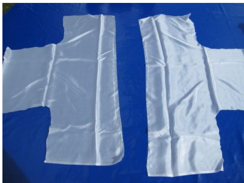
Silke til babyjakke

Hvordan Boble-plast plasseres på bordet og legg tekstilen oppå. Dra ut ull fra den karda tullen. Legg ulla jevnt på stoffet, slik at fibre ne ligger jevnt en vei og at de overlapper hverandre litt. Neste lag legges motsatt vei. Hvor mange lag med ull du bruker, kommer an på tykkelsen på det ferdige stoffet.